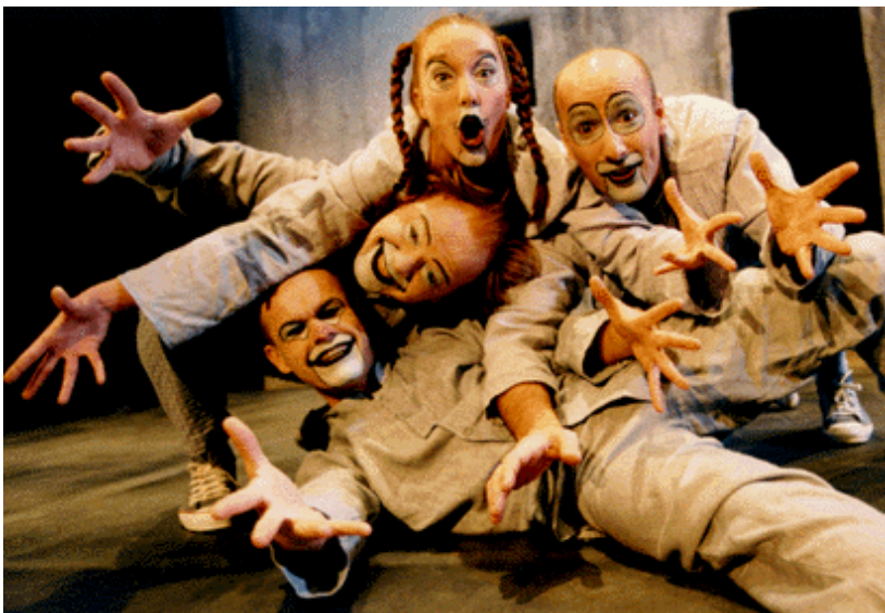
Från Teater Hallands uppsättning av 'Hamlet - om vi hinner'.

Dario Fo – italiensk teaterman, född 1927. Han fick nobelpris i litteratur 1997.