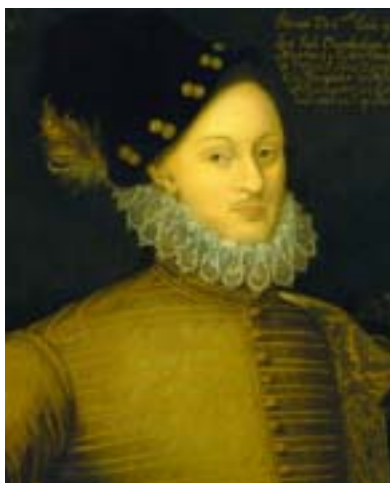
Edward de Vere 1550-1604